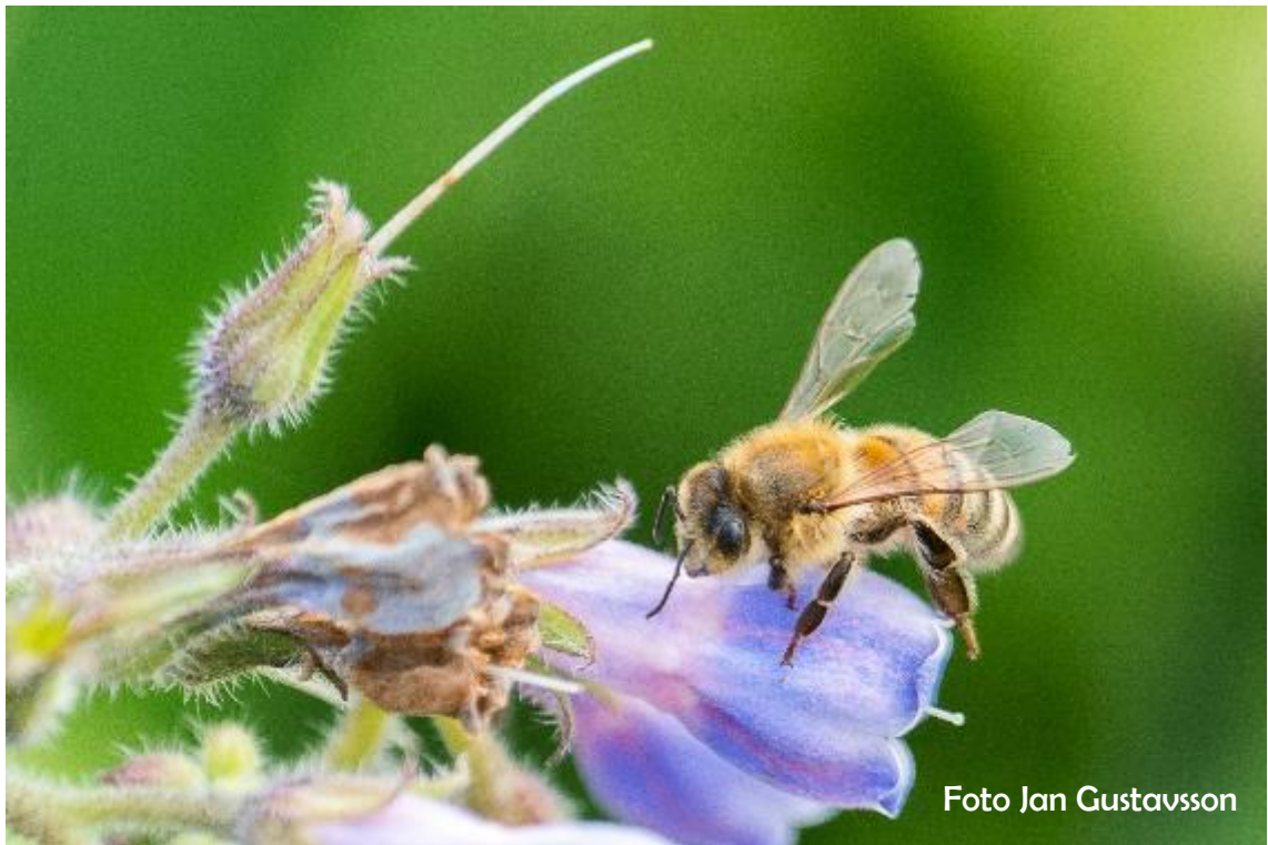
Bi i Flottsbrobacken på midsommarafton

Årsberättelse för Huddingeortens Biodlareförening