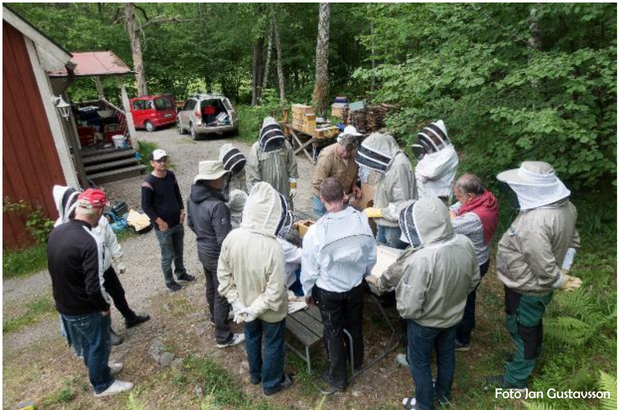
Foderdeg till apideorna förbereds.