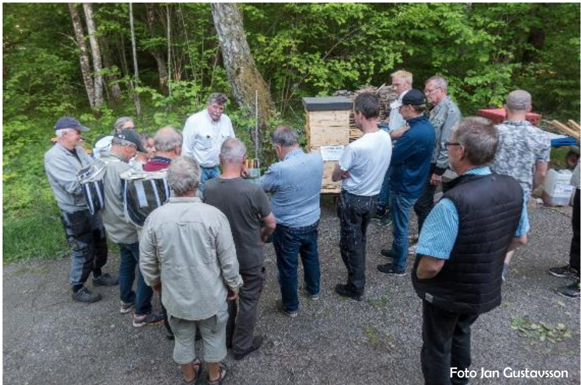
Medlemsmöte på Sundby