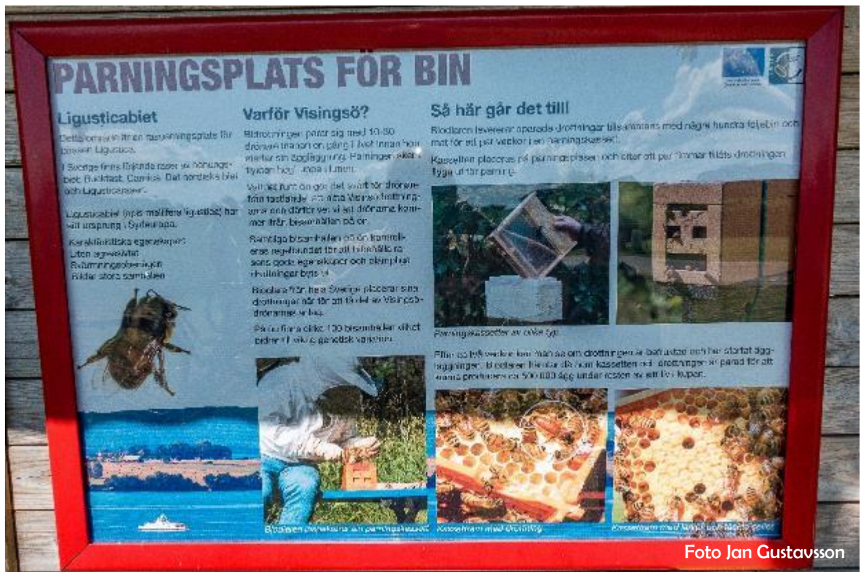
Några av föreningens medlemmar har besökt en biparningsplats på Visingsö.