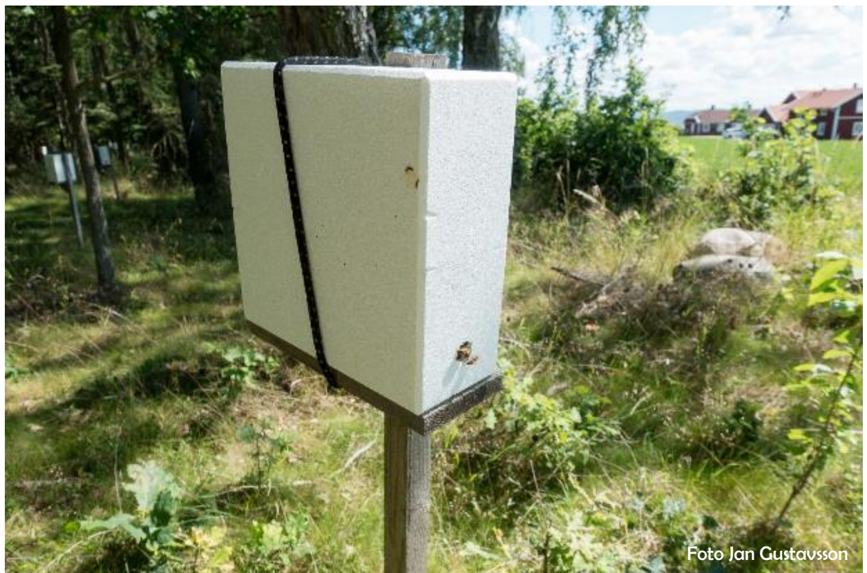
En parningskupa på Visingsö. Det finns hundratals av dem i området.