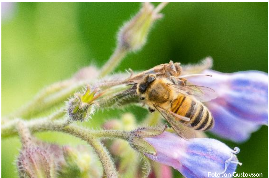
En dag på jobbet för ett bi.

Avsluta vinterfodring och varroabekämpning