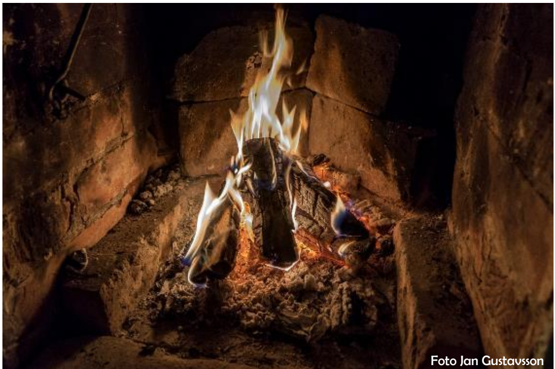
Höstbrasa i föreningsstugan.

Kontrollera att snö ej täcker ventilationsöppningarna