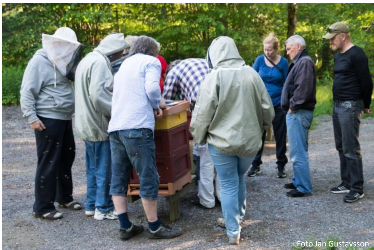
Foderkontroll på Sundby

Biodlare och intresserade hälsas hjärtligt välkomna!