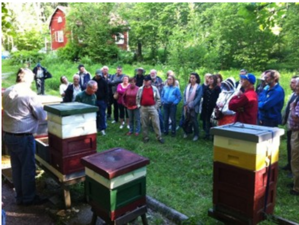
Biodlarvänner från flera andra föreningar inom distriktet kom till oss i somras och såg vår egen finurliga långbänkskonstruktion för effektivare drottningodling.