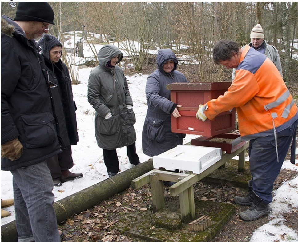
Praktisk handledning i vårsnön för intresserade kursdeltagare.

Så önskar vår ordförande effektivisera vår förening och därmed öka nyttan för medlemmarna. Tyck till!