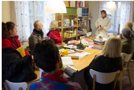
Teorilektion i Sundbystugan

En väl planerad och förberedd kurs i drottningodling. Inhämtning av kunskap om utveckling av egna bigården.