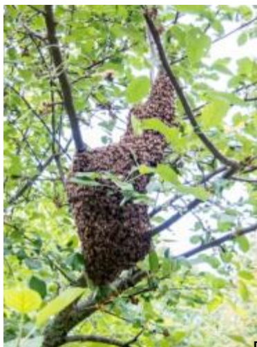
Innan svärm och fullbordad svärm