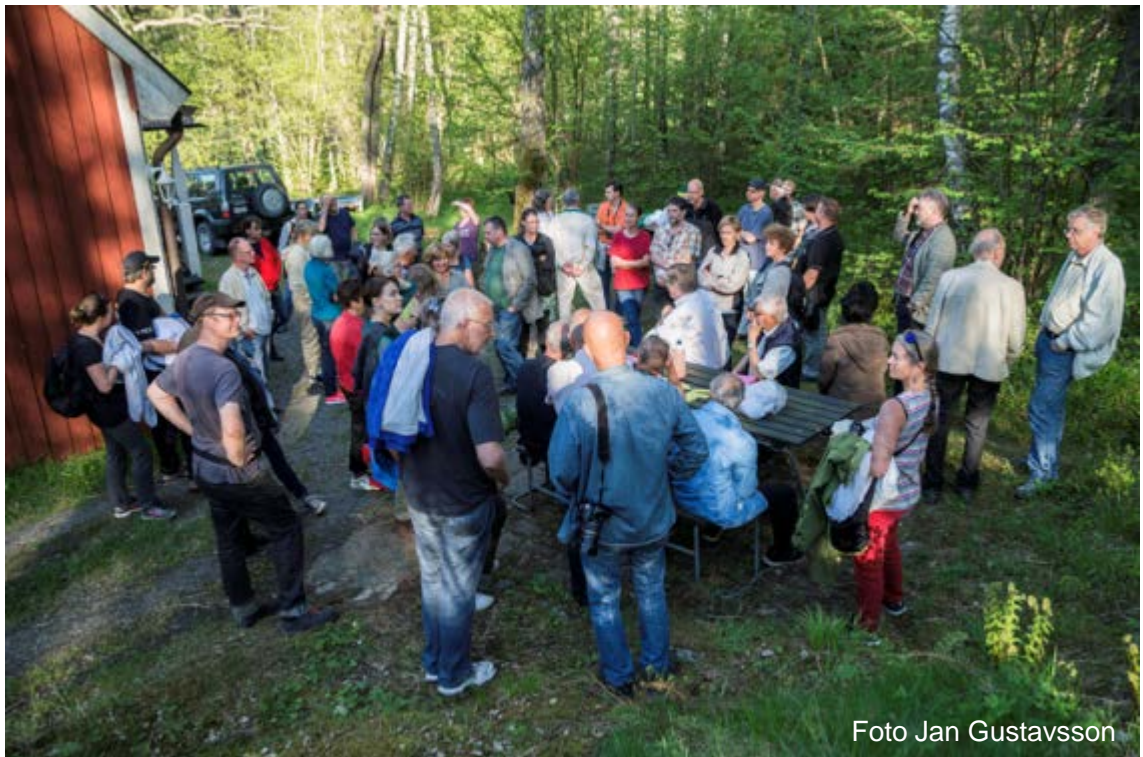
Medlemsmöte på Sundby